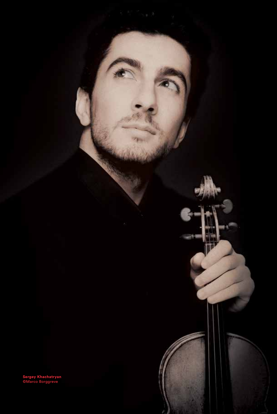
Sergey Khachatryan