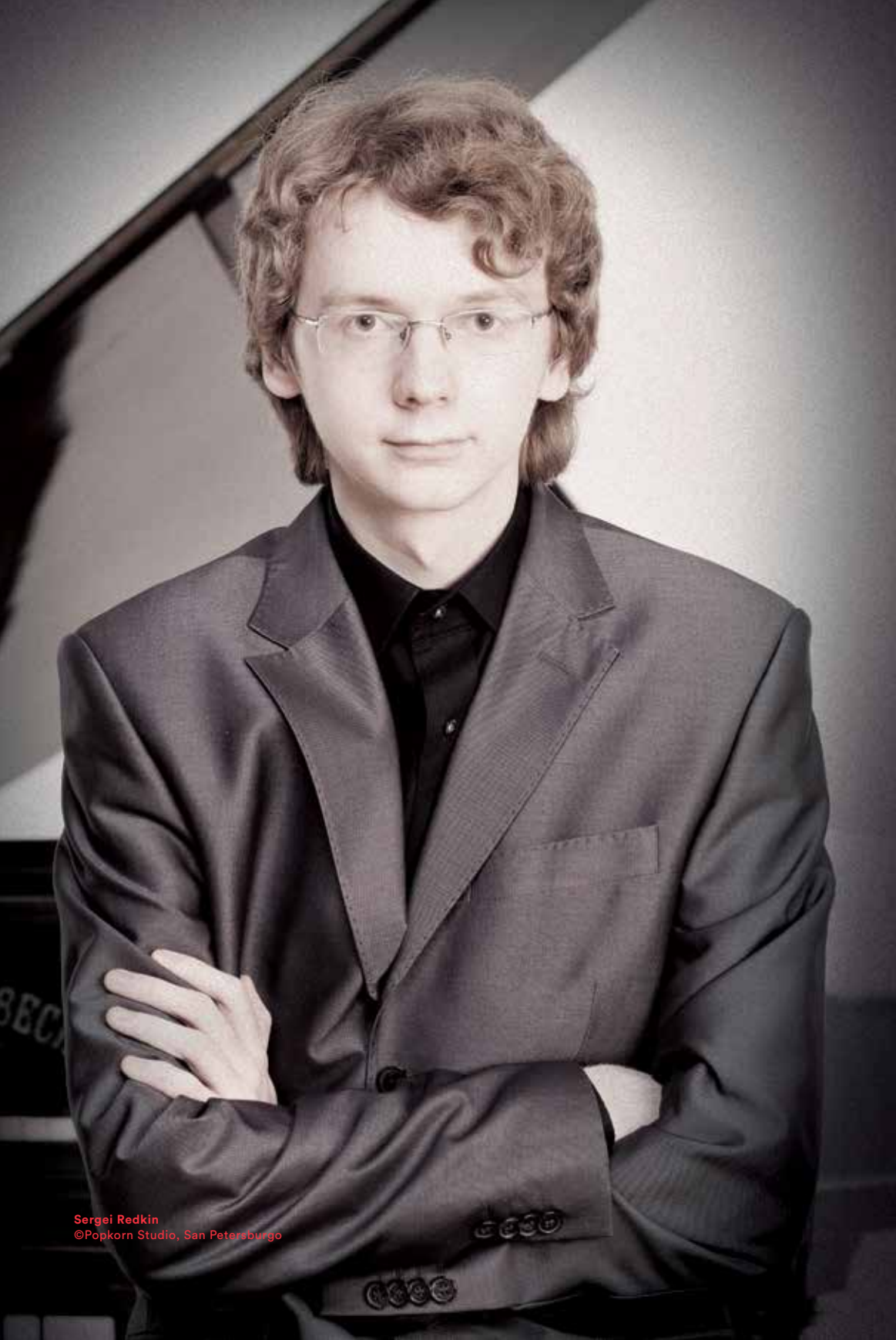
Sergei Redkin