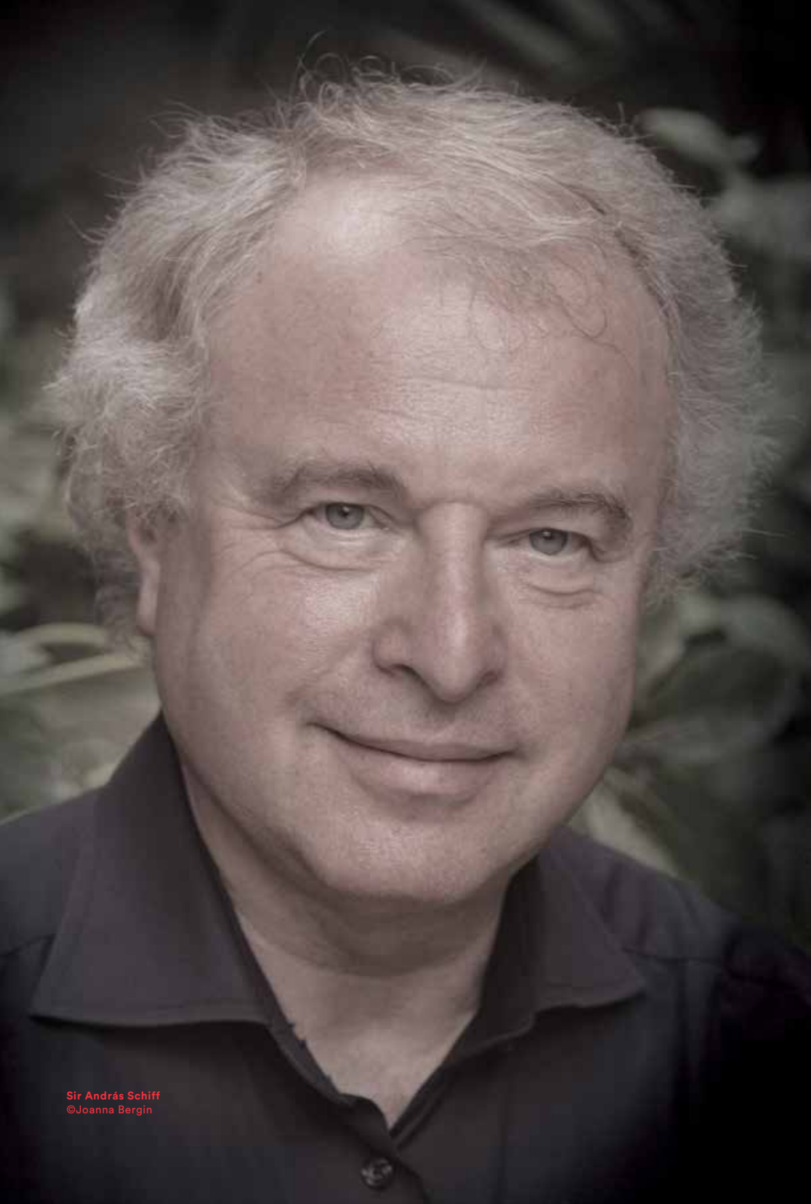
Sir András Schiff